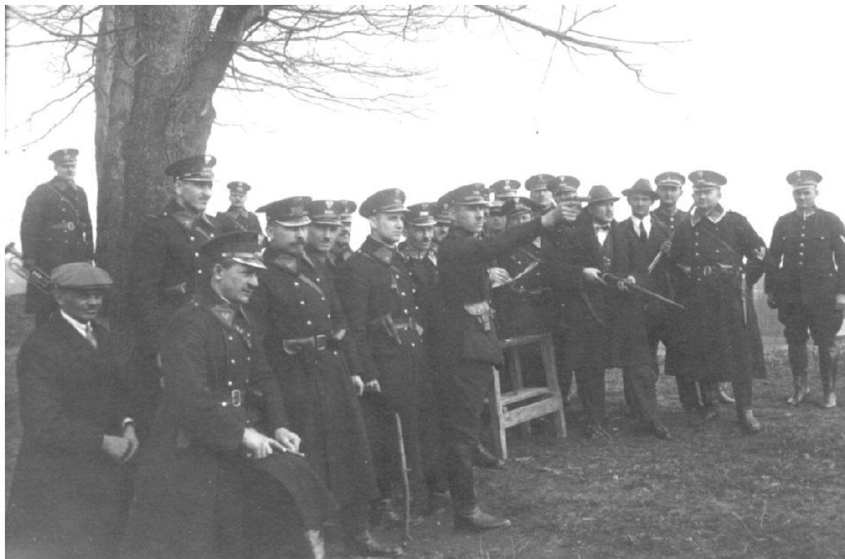
Szkolenie strzeleckie na strzelnicy 11. Pułku Piechoty WP w Tarnowskich Górach, funkcjonariuszy Policji Województwa Śląskiego.

Policja Województwa Śląskiego znajdowała się na bardzo dobrym poziomie wyszkolenia zawodowego, które to z kolei gwarantowało oficerom i posterunkowym wzorowe wykonywanie zadań służbowych wynikających z toku pełnienia służby śledczej i mundurowej.