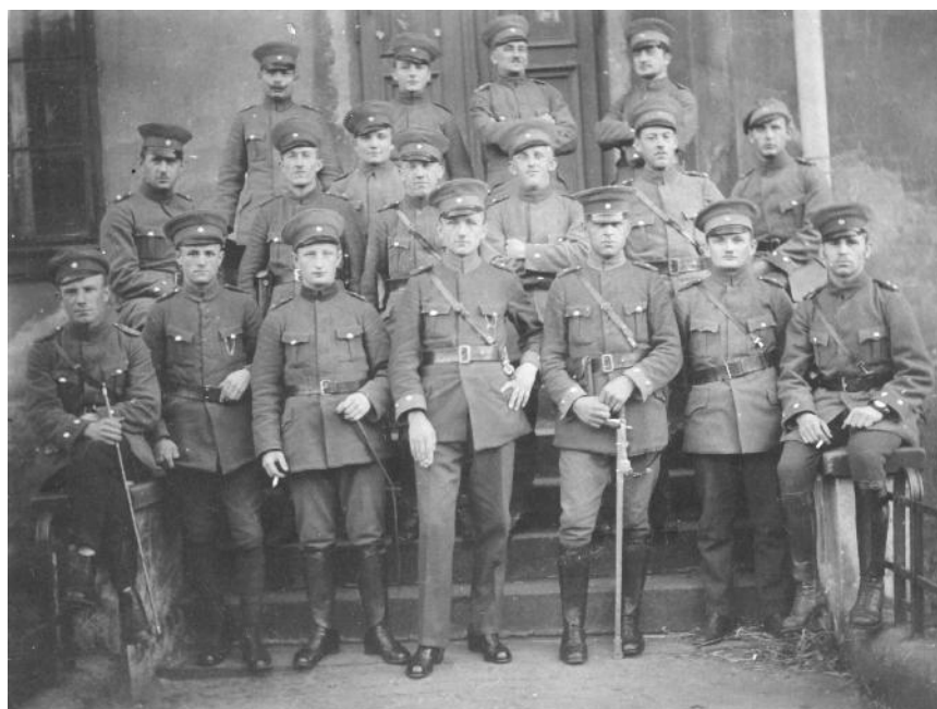
Polscy funkcjonariusze Policji Górnego Śląska ( Policji Plebiscytowej ).

Za cenę zakończenia II Powstania Śląskiego udało się Polskiemu Komitetowi Plebiscytowemu wyrzucić na „Radzie Trzech” szereg ustępstw na rzecz Polaków. Najważniejszym z nich było wycofanie z terenu przyszłego plebiscytu niemieckiej Sicherheitspolizei i zastąpienie jej przez nowo utworzoną Policję Plebiscytową, która z czasem zmieniła nazwę na Policję Górnego Śląska na prawie parytetu, tzn. zgodnie z tym połowę funkcjonariuszy Policji mieli stanowić Ślązacy polskojęzyczni mający równorzędne prawa i obowiązki służbowe co funkcjonariusze niemieccy.