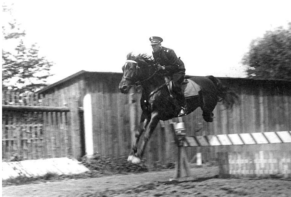
Szkolenie konne funkcjonariusza Policji Województwa Śląskiego, Bielsko 1937r.

Komendy powiatowe i miasta miały na swoim stanie samochody osobowe i ciężarowe, motocykle oraz rowery. W 1939r. park samochodowy będący na stanie Policji Śląskiej wynosił: 12 samochodów osobowych, 5 autobusów, 2 samochody pół-ciężarowe, 7 motocykli oraz ok. 400 rowerów, które były wyprodukowane w Państwowej Fabryce Uzbrojenia w Radomiu.