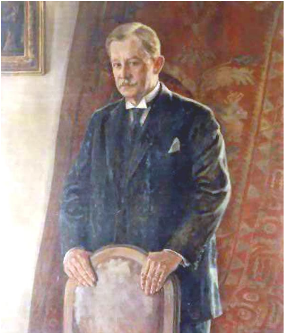
Wojciech Korfanty 1873 - 1939